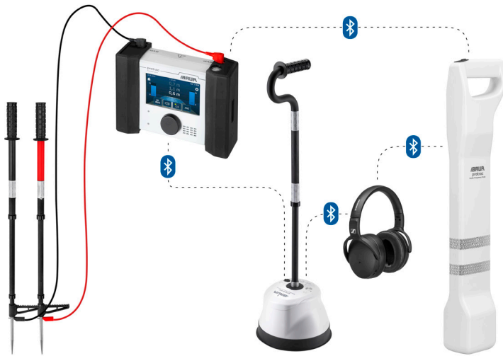
Figura de exemplo